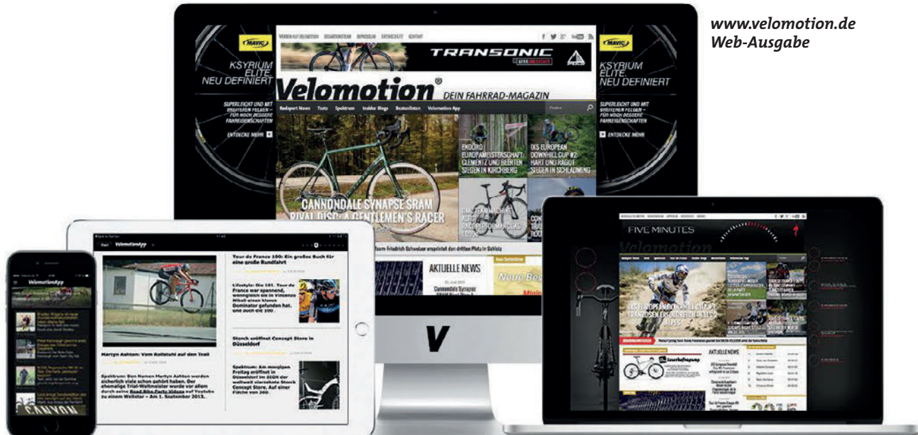
Velomotion mobile + App für Smartphone und Tablet